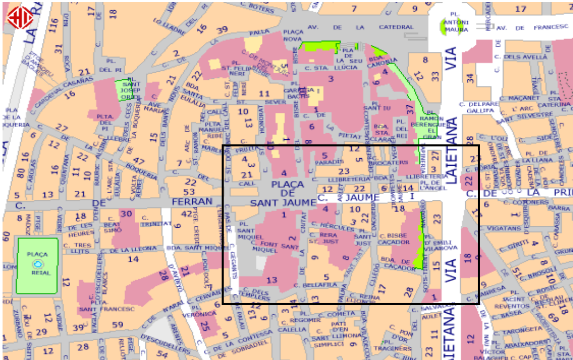
II-l·lustració 1. Vista general del Barri Gòtic, el cor de la ciutat antiga