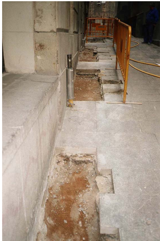
Imatge 4. Vista de les cales practicades al carrer d'Arlet, abans d'excavar