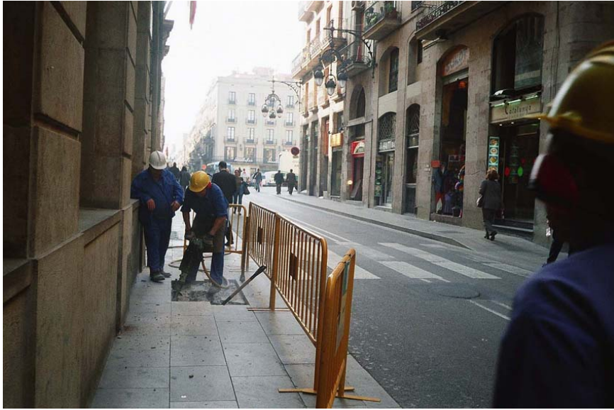
Imatge 1. Treballs d'obertura de la rasa al carrer Jaume I