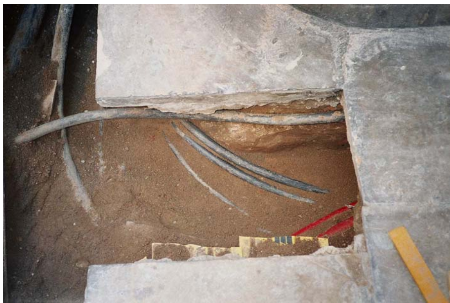
Imatge 7. Detall de l'estructura 103 que es troba a la CALA 3