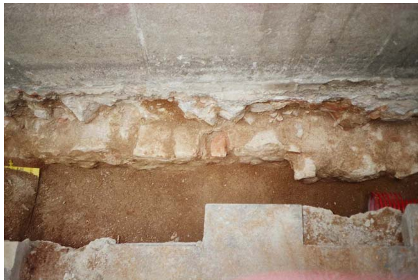
Imatge 6. Detall de l'estructura 103