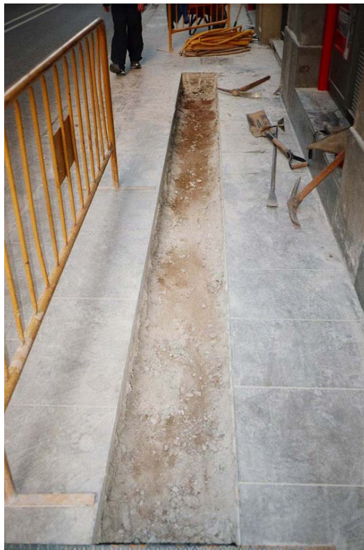
Imatge 2. Vista d'un tram de rasa, extret el paviment