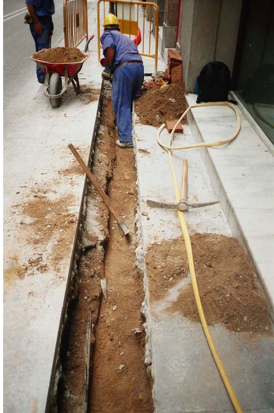
Imatge 3. Treballs d'excavació de la rasa