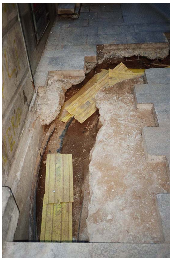
Imatge 8. Vista de la CALA 2