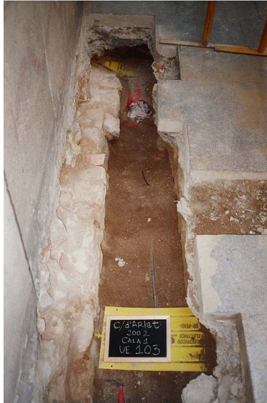
Imatge 5. Vista de la CALA 1 amb l'estructura 103 al marge esquerra